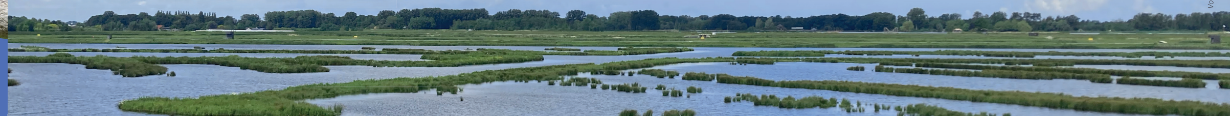
Vormgeving: Océlaet Onwerp