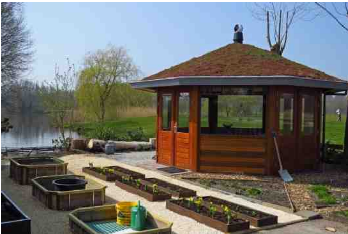
De inrichting van het achterterrein van het Trefpunt werd voltooid met de aanleg van de tuin.

Het achtererf is het afgelopen jaar helemaal opgeknapt; op het betonnen pleintje zijn bakken gemaakt met verschillende grondsoorten en dus verschillende planten, kleine specifieke biotoopjes. Het tuingedeelte is opgeknapt met dusdanige plantenkeuze dat het een vlinderidylle is geworden. Tegen de achtergevel is een strook ingericht als moestuin. Ook de bijen van 'onze' imker varen er wel bij.