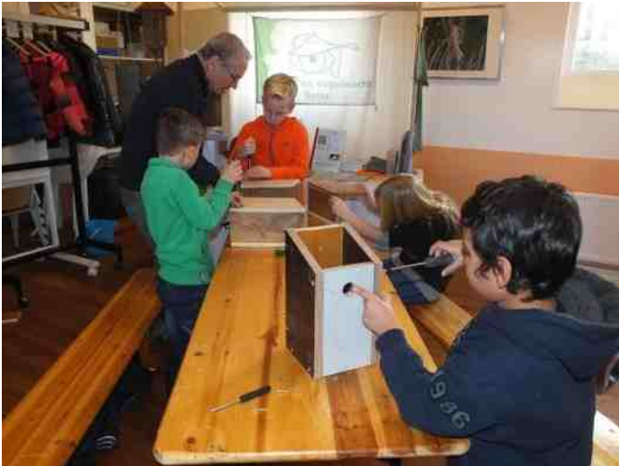
Jong en oud geconcentreerd aan de slag

Leiding en vrijwilligers, hartelijk dank voor jullie bijdragen.