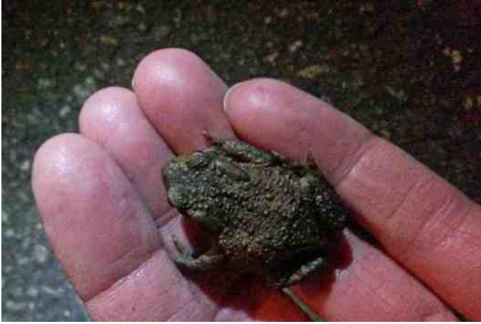
Gered van een wisse dood

Normaal gesproken verlaten volwassen salamanders en hun kroost in het najaar het water, maar er zijn uitzonderingen. Salamanders die in het water overwinteren, doen dit in modderige bodems en gaan overwegend over op huidademhaling. De soorten die door de longen blijven ademen, moeten af en toe naar de oppervlakte om lucht te happen. In de zomer gebeurt dat zeer regelmatig en snel, in de winter vindt dat traag met grote tussenpozen plaats. De stofwisseling is immers sterk gereduceerd. Salamanders, zoals de gewone of kleine watersalamander en de alpenwatersalamander, alsook de vinpootsalamander ( T. helveticus ) en de vuursalamander ( Salamandra salamandra ) overwinteren allen op het land, vaak in groepen in holen of onder hout en stenen.