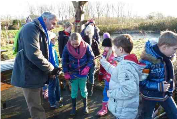
Rotta Rangers verdiepen zich in over-winter-en.

Deze zeer actieve groep groeit in aantal en daardoor in bijeenkomsten. Was er vroeger één groep per maand, tegenwoordig is er een ochtend- en een middaggroep Rotta Rangers , dus geen wachtlijst voor deze groep van 296 kinderen. Voor de kleintjes van 4 tot 6 jaar, de Kapoentjes , is er één keer per kwartaal een gezellige educatieve woensdagmiddag, 55 kinderen staan op deze ledenlijst. Ieder jaar worden er minstens twee nieuwe activiteiten bedacht. Voor de kinderen is ons nieuwe tuinhuis ideaal. De Kinderwerkgroep doet steeds verslag op de site, ook staat er regelmatig een artikel van hen in Aves Visum en zij sturen informatie naar de kinderpagina van Hart van Holland. Zo'n actieve groep kan dus nog wel wat extra mensen gebruiken bij dit leuke werk om de volgende generatie minstens zo natuurbewust te maken.