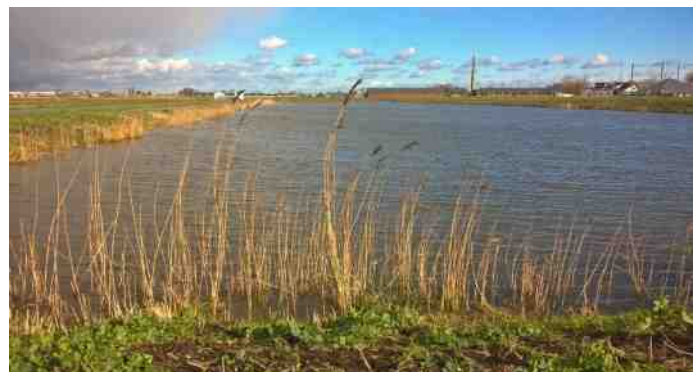
Groenzoom bij de Meerweg