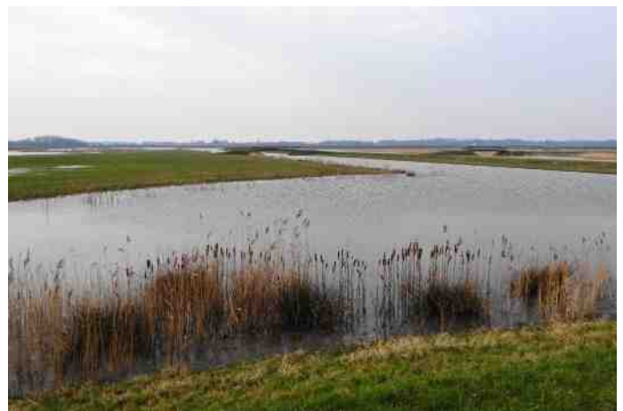
Publiekswandeling in de Eendragtspolder

Bovendien is er in de maanden juli en augustus iedere vrijdagavond onze traditionele wandeling door het Koornmolengat. Afgelopen zomer waren ze zeer druk bezocht, mede dankzij de aankondigingen in de lokale pers.