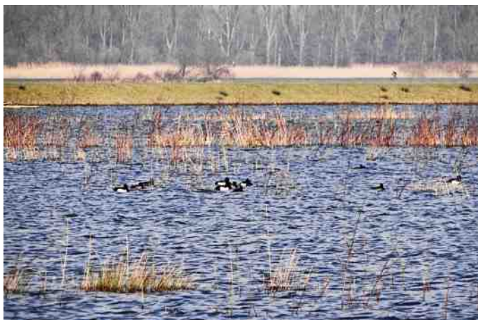
Kuifeenden bij de ondergelopen eilandjes langs de roeibaan in de Eendragtspolder

Waterhoenen zijn doorgaans heel schuw en hun nesten zijn goed verborgen. Dit in tegenstelling tot zijn neefje de meerkoet. Die heeft zijn nest open en bloot in 't zicht en is verre van schuw. We wandelen naar de Eendragtspolder (EDP) en zien direct al meerkoeten, wilde eenden, een gaai, spreeuwen, koolmezen en pimpelmezen. De torenvalkkast bij de kassen is nu nog leeg, maar in het voorjaar zit daar zeer zeker weer een heel gezinnetje in. Altijd zie je dan pa of ma op de uitkijk zitten. Even verderop: grauwe ganzen, een veldleeuwerik, een vlucht kieviten en tegen de dijk scharrelen drie holenduiven hun kostje bij elkaar. Heel bijzonder, want je ziet niet zo vaak holenduiven.