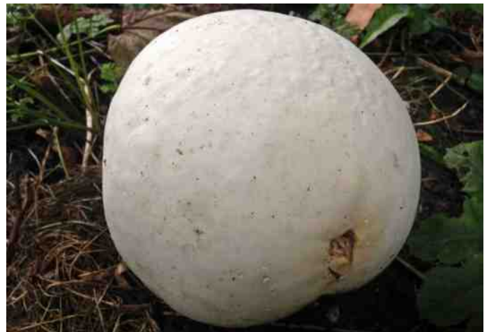
Ook lekker, een reuzenbovist gepaneerd, gebakken in de frituur en met knoflooksaus

Kijk voor meer mogelijkheden en andere recepten eens op internet bij www.eetbarewildeplanten.nl en www.bloemenpad.nl . Veel plezier met het oogsten en het bereiden en eet smakelijk!