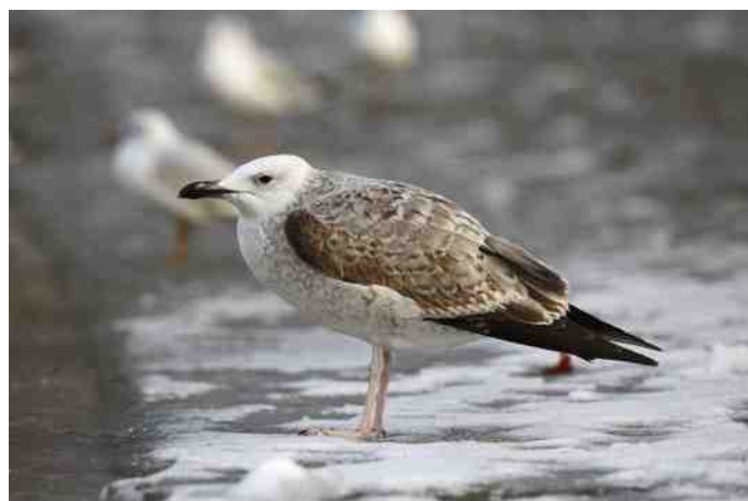
MB 79