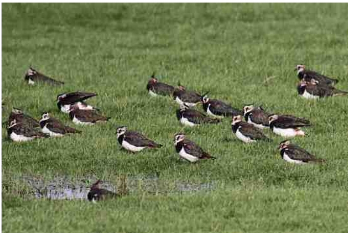
Kieviten in de Bergboezem in Rodenrijs

Aanvankelijk broedde de kievit op grassteppen in Oost-Europa en Azië. Maar toen de steppen steeds meer werden gebruikt door de mensen voor het hoeden van vee, verbouw van gewassen en bewoning, moest de kievit uitwijken naar andere gebieden. Graslanden en maïsakkers bleken een goed alternatief te zijn. Daardoor wordt de kievit nu bij ons tot de weidevogels gerekend.