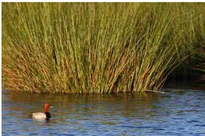
MB 77 Tafeleend

Indien onbestelbaar retour: Hoeksekade 164, 2661 JL Bergschenhoek