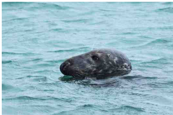
Een grijze zeehond die even poolshoogte komt nemen

We rijden naar ons laatste kijkpunt, via Scharendijke naar de Brouwersdam. Een gure wind verwelkomt ons als we de auto uitkomen, het stilhouden van de kijker is een hele toer. Ook Belgische vogelaars hebben deze spot gevonden. Als eerste zien we vlak voor ons tussen de basaltblokken steenlopers en paarse strandlopers, op zoek naar insecten en ander eetbaars. Op zee een roodkeelduiker en verderop nog eens drie, ze liggen laag op het water. Een middelste zaagbek duikt regelmatig onder en is steeds maar kort in beeld. Zijn kopveren wapperen in een prachtig gegolfde kuif over zijn kop. Twee brilduikers worden gesignaleerd en terwijl we de kijkers richten, duikt er een zeehond op. Jaloers, wil hij aandacht? Het lijkt echt of hij weet heeft van al die ogen die op hem gericht zijn. Kijk volgende keer maar eens goed, het is net of hij glimlacht, wat een geinige snuit. Gewone fuut en kuifduiker duiken naar voedsel. Het verschil tussen deze twee soorten is dat de laatste kleiner en donkerder is en een bredere kop heeft. Met de telescoop is dat natuurlijk nog beter waar te