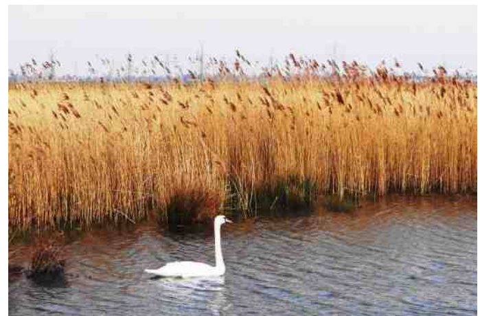
Knobbelzwaan bij de Zevenhuizerplas

We gaan van de gebaande weg af en we klunen door modder en drassig gras naar de Zevenhuizerplas (ZHP). Hier zien we watervogels die we al eerder in de EDP gezien hebben, maar er staat ons nog een grote verrassing te wachten: krooneenden en krakeenden. Hier doen we het nu allemaal voor. Onze tocht voert ons langs het verdronken populierenbosje. Hier is veel gemaaid en gezaagd zodat er weer plaats is voor nieuw riet en nieuwe planten. Het was een zeer plezierige en aangename wandeltocht. Rien, bedankt voor alles wat je ons hebt laten zien en wat je ons hebt verteld, ook dank aan alle deelnemers en tot een volgende keer.