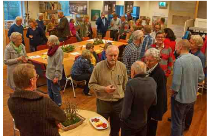
Gezelligheid troef op de vrijwilligersmiddag