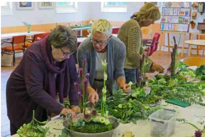
Bloemschikcursus, een andere vorm van groenbeleving

Na het succes van vorig jaar heeft Euroster ook dit jaar weer een cursus 'Weer- en sterrenkunde voor beginners' gegeven in het Trefpunt. Ook Rotta's eigen cursus "Vogelherkenning voor beginners" was weer een succes. Er zijn cursisten die deze cursus twee jaar volgen, want alle begin is moeilijk en "bij de tweede keer ga je al steeds meer herkennen en de bijbehorende excursies zijn steeds weer anders en leerzaam." In februari 2016 is de nieuwe cursus voor BMP-tellingen van start gegaan in samenwerking met de Vogelwerkgroepen van Delft en Pijnacker en Sovon om nieuwe tellers/gidsen op te leiden.