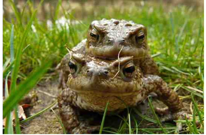
Bij de voortplanting omklemt het mannetje het vrouwtje

eigenlijk alleen maar voor in schoon water met weinig tot geen verontreiniging. Alle salamanders in Nederland staan op de rode lijst. Dit komt omdat ze veel meer vijanden hebben dan eigen voedsel. Ook komt dat omdat wij steeds meer woonwijken bouwen op hun leefplekken en worden er veel doodgereden door het toenemende verkeer. Volwassen salamanders leven op het land en alleen tijdens de paartijd verblijven ze in het water. Jonge salamanders leven de eerste maanden van hun leven in het water, ze moeten wel omdat ze dan alleen kieuwen hebben en nog geen longen. Sommige kamsalamanders ( Triturus cristatus ) leven hun hele leven in het water. De larven van deze soort zijn soms pas in het tweede jaar volledig ontwikkeld en verlaten dan pas het water. Een enkeling blijft echter zijn gehele leven 'larve', dus met uitwendige kieuwen. Dit wordt neotenie genoemd en komt zowel voor bij de gewone of kleine watersalamander ( Triturus vulgaris ) als de alpenwatersalamander ( T. alpestris ).