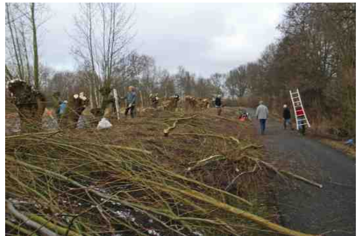
Rotta Natuurwerk knot wilgen bij het Koornmolengat.

In de afgelopen 5 jaar zijn we 7100 uur in touw geweest, ook buiten het recreatiegebied. Ieder jaar storten G.Z-H en particulieren hiervoor een bijdrage in de Rotta clubkas. Om onze vrijwilligers te bedanken voor hun inzet wordt ieder jaar in april een educatief uitje georganiseerd.