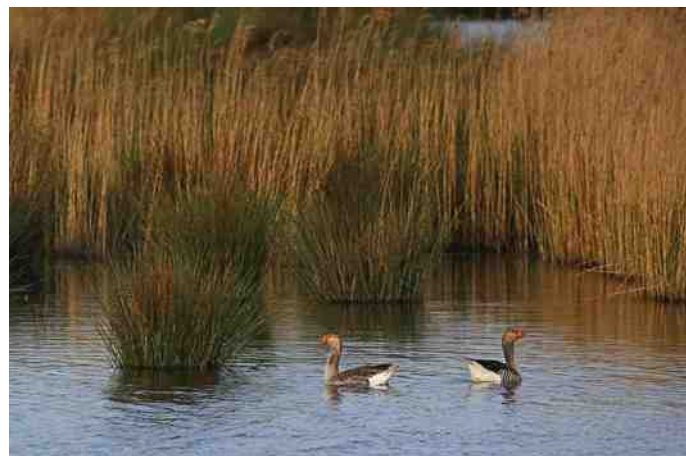
MB 78 Grauwe ganzen