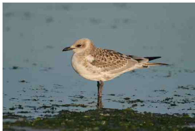
MB 80