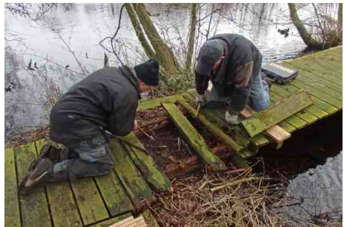
Ongeveer 2400 planken van het vlonderpad in het Koornmolengat moeten worden vervangen.

Deze, nog steeds groeiende groep zet zich iedere donderdag en één keer per maand op zaterdag in voor onderhoud van natuurgebiedjes. Ook het aantal werkgebiedjes groeit. Naast de vaste werkgebieden Koornmolengat, Wiebertjes en Nesselbos wordt er ook gewerkt in Park de Polder, Noordoever van de Zevenhuizerplas, Hoekse Park en Kooipolderbosje. Samen met de mensen van Onderzoek wordt een beleidsplan opgesteld. Dan kan er begonnen worden met maaien, knotten, uitdunnen, maken van houtrillen, broeihopen en wilgenschermen. Dat alles om verschillende biotopen in stand te houden en kwetsbare en bedreigde planten en dieren leefruimte te geven. De groep en het aantal gebieden is nu zo groot dat het werk is onderverdeeld onder gebiedscoördinatoren. Zij verdelen en geven sturing aan het werk. Zo wordt het beleid door een grotere groep gedragen. Ook is er bij een aantal particulieren gewerkt, onder andere wilgen geknot.