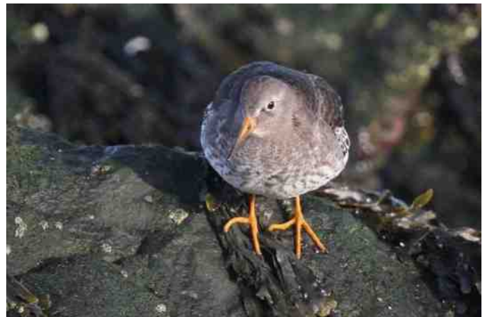
Paarse strandloper op de Brouwersdam

Gelukkig is het droog als we de uitspanning verlaten. De optimist krijgt gelijk, al is het steeds van korte duur. Onderweg noteren we een grote zilverreiger, twee hazen en een buizerd, en een kleine zilverreiger. Onze volgende stop, het moerasgebied 'de Inlagen' op Noord-Beveland, levert een diversiteit aan soorten op. Vlak voor ons busje jaagt een vrouwtje torenvalk. Terwijl we haar volgen komt er een andere rover laag aangevlogen, waarbij hij van links naar rechts zwenkt. We denken allemaal aan een bruine kiekendief, tot Jan Kees roept: "Het is een velduil!" Meteen schiet iedereen in de kijker, en we gaan snel naar buiten om hem te kunnen volgen. Wat heeft dat dier een goede schutkleur! Vlakbij duikt hij het ruige grasland in, en meteen kleurt hij in met het landschap. Hij verdwijnt tussen de vaal beige stoppels en wij hebben het nakijken. Al weet je waar hij is geland, je kunt hem niet meer vinden. Het geeft ons wel een kick. Dachten we een uur geleden nog: "Laten we maar naar huis gaan", nu zijn we blij dat we hebben doorgezet, want dit is wel een hele leuke waarneming. In dit plas/grasgebied zitten volop smienten die zo nu en dan een fluittoon laten horen en enkele grazende knobbelzwanen, altijd bedachtzaam en waardig. Een tureluur, in dit grauwe weer her-