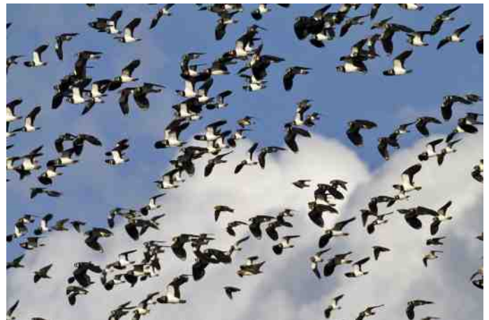
Kieviten in vlucht

Daarnaast zijn er dan nog de gevaren van koeien die in de wei komen in het voorjaar en het maaien van het gras. Beide kunnen veel nesten en/of kuikens doen sneuvelen. Door weidevogelbescherming, het plaatsen van nestbeschermers en/of stokken bij de nesten kan het verlies aan kuikens beperkt worden. Hoewel het beschermen van nesten niet alle gevaar wegneemt, omdat de kuikens dan moeten foerageren op kaal grasland, met minder insecten en dan zijn ze gemakkelijk te vinden door predatoren zoals blauwe reiger, buizerd, zwarte kraai enz. De kans dat er een gezond kuiken uit een ei komt is een stuk groter dan de kans dat het kuiken volwassen wordt.