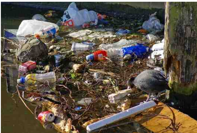
Meerkoet verzamelt nestmateriaal in een Haagse stadsgracht.