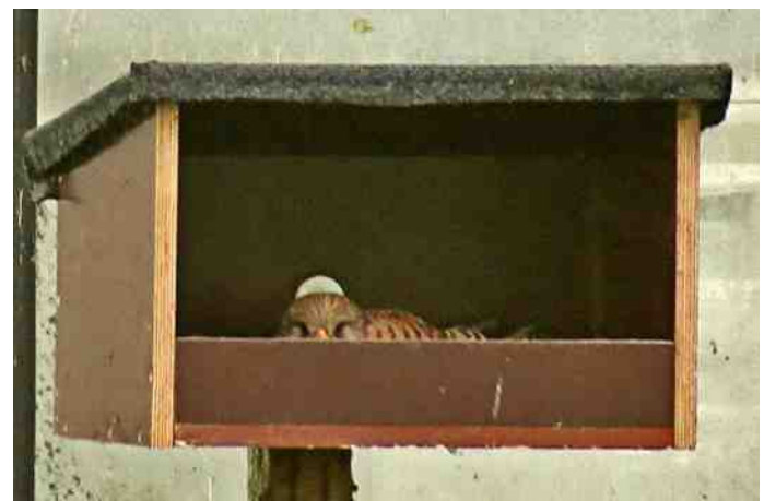
Torenvalk in nestkast