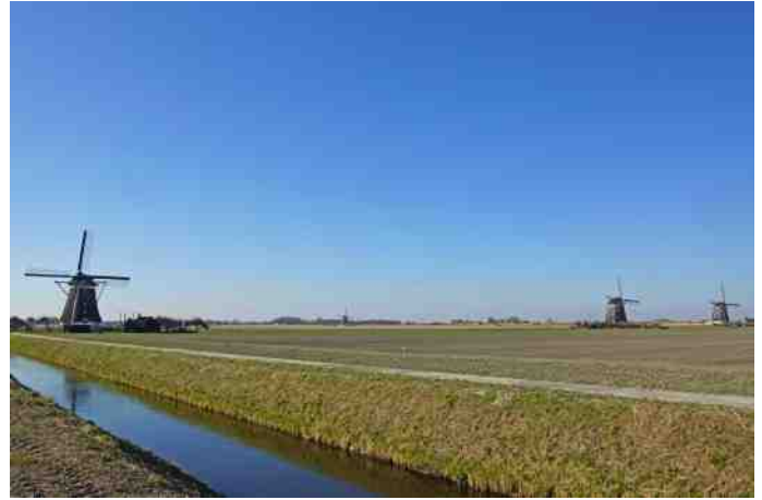
'Jachtgebied' Tweemanspolder met de molenviergang

Ten behoeve van het WK Roeien in augustus van dit jaar is het waterpeil in dit deel van de waterberging inmiddels met 1 meter verhoogd; de moerasedlandjes liggen nu geheel onder water en