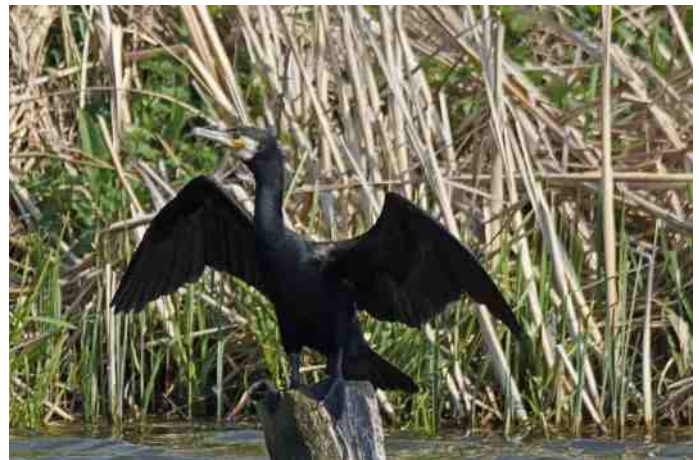
Twee Vissen Op Grote Afstand

En oh ja, op de valreep spotte ik nog een raar vliegdier, vidi ridiculum volare animal!