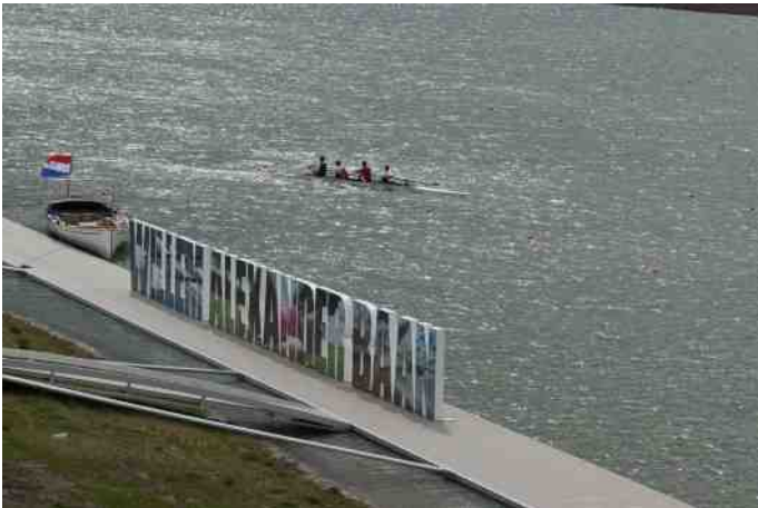
Willem-Alexander roeibaan bij de opening in 2013

We moeten ons wel realiseren, dat deze 'badkuip' primair een berging is voor overtollig water in de Rotte. Dat betekent dat alle eilandjes in zo'n situatie geheel onder water komen te staan, ook al zou dat in de vogelbroedtijd zijn. Bij extreme calamiteiten wordt ongeveer 1 miljoen m 3 water in de natte graslanden geborgen, ook daar liggen de weilanden dan onder water. Statistisch is destijds berekend dat dit zo eens in de 10 jaar voor zou kunnen komen. Echter sinds de ingebruikneming in 2013 is er al twee keer water uit de Rotte tijdelijk in geborgen, maar gelukkig waren beide gevallen niet in het broedseizoen.