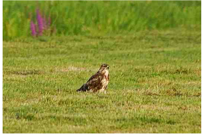
Buizerd op jacht in de Eendragtspolder

Om dit te voorkomen heeft G.Z-H de opdracht gegeven aan het Ingenieursbureau Witteveen en Bos uit Deventer te onderzoeken wat de impact op de flora en fauna is wanneer het waterpeil al in de komende winter met een meter verhoogd zou worden naar 3 meter, zodat de eilandjes al vóór het broedseizoen onder water komen te staan. Hiermee wordt voorkomen dat de vogels er nesten gaan maken. In de opdracht is expliciet opgenomen dat dit Bureau de Natuur- en Vogelwacht Rotta inhoudelijk consulteert.