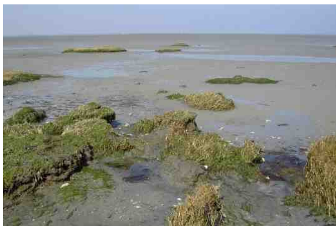
Verdrongen Land van Zuid-Beveland

Later gidste ik op de slikken en schorren van het Galgeschoor, Groot Buitenschoor en het Verdrongen Land van Zuid Beveland. De desolate ruigheid met de bijzondere zoutminnende of zoutverdragende flora, daarin voel ik mij in mijn element. Planten als Zeekraal, Zulte of Zee-aster (wordt verkocht als de groente Lamsoor), Lamsoor, Gewone Zoutmelde, Zilte schijnspurrie etc. en niet te vergeten de hermafrodiete slak Muiltje ( Crepidula fornicata ). Alle Muiltjes worden geboren als slanke beweeglijke mannetjesslakken, na paring veranderen zij in immobiele dikke vrouwtjes. De natuur gaat zijn gang en heeft niets te maken met het onvermogen van de mens met de mond vol tanden!