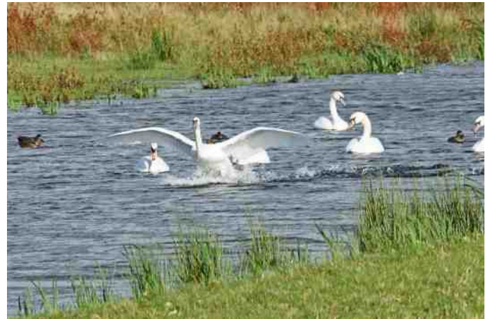
Knobbelzwanen in het plas/drasgebied

Daarnaast is het opvallend hoe vlinderrijk het gebied is, zijn er relatief veel libelles te zien en legeren er in de vochtige weilanden veel hazen. Ook moet de massale aanwezigheid worden genoemd van Gewone poelslakken ( Lymnea stagnalis ) op drooggevallede moerasdelen in de natte graslanden.