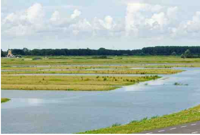
De moerasedlandjes naast de roeibaan

Rotta geeft in het vaste beheerdersoverleg met het Recreatieschap Rottemeren/G.Z-H, HHSK, de Stichting Willem-Alexanderbaan, Dewido BV en de gemeenten Rotterdam en Zuidplaspolder (on)gevraagd adviezen over het beheer van de Eendragtspolder. Bijvoorbeeld door aan te geven op welke tijden - in plaats van te klepelen - bepaalde gras- en bloemrijke (ei)landjes het beste kunnen worden gemaaid en of het hooi al dan niet dient te worden afgevoerd.