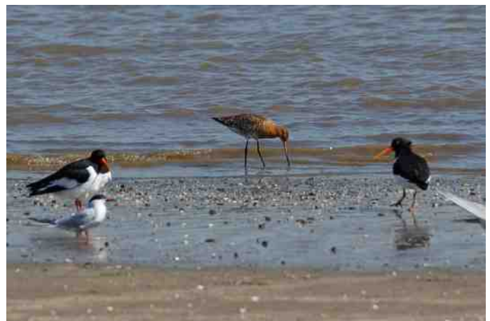
Voeragere in de Hollandse IJssel

Meer informatie over Hitland op de website www.hitland.info , op de site van het Platform Mooi Zuidplas ( www.mooizuidplas.nl ) kun je een wandeling (ongeveer 10 km) downloaden, maar rondstruinen op je eigen kompas door dit schitterende landschap kan ik van harte aanbevelen. Laat je verrassen en vergeet vooral je verrekijker niet.