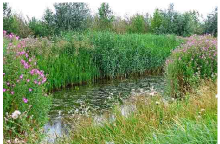
Doorkijkje Wilderszijde

Intussen is er nog een opzienbarende ontwikkeling te melden die bij het goede nieuws over de Groenzoom hoort. Bij het zoeken naar een contactpersoon namens de beheerder in de Groenzoom is de keus gevallen op ons bestuurslid Cor Noorman. Hij wordt degene die niet alleen de dagelijkse gang van zaken in het gebied gaat aansturen en bezoekers ontvangt, maar zich bijv. ook bezighoudt met de monitoring van de natuurontwikkeling. Voor Cor een prachtige job, een felicitatie waard, zijn hobby wordt zijn werk kun je zeggen. Al zal hij zeker ook dingen tegenkomen die niet direct als hobby aanvoelen. Al met al bieden deze benoemingen uitzicht op een mooie toekomst voor de Groenzoom!