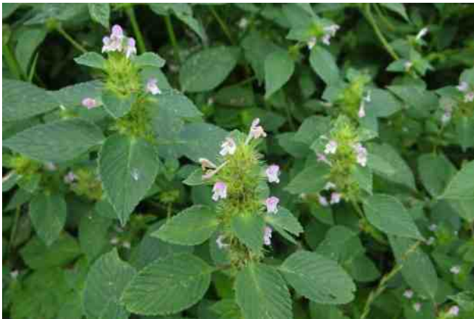
Hennepnetel © Piet Mulder

700 v.Chr. Enkele heuvels zijn afgeschermd met palen. Bij de heuvels staan bordjes met het verzoek de heuvels niet te beklimmen, veel wandelaars hebben moeite met lezen! We zien een dependance van imkerij de Moerbei. De Bijen genieten volop van de bloeiende Struik- en Dopheide. De heide wordt gefaseerd afgeplagd, dit ter voorkoming van overwoekering door grassen (vooral Pijpestrootjes) en Berken. De kudde schapen die we zien kan onmogelijk het hele heidegebied 'bedienen'. Er lopen veel Konijnen rond, overal zie je hun holen. Konijnen eten hun eigen keutels, omdat er in die keutels nog veel voedingsstoffen zitten. Tapsmoer- de naam betekent Veen in eigendom van het abt - is de enige vogelkijkhut (VKH) in dit gebied. De hut is gebouwd door leerlingen van het plaatselijke ROC en biedt uitzicht over het dal van de Oude Leij. Vanuit de hut zien we drie suffige Lepelaars, een Blauwe Reiger, een Boerderijgans en wat Buizerds. In het lagere gedeelte zijn wat vijvers en slootjes, het water ziet er erg ijzerhoudend uit, net een soort bruine drab. De vijvers zijn aangelegd om bluswater te hebben, mocht er een hoeve in brand staan en het vee kan er water uit drinken.