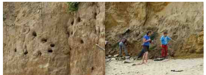
Gewemel op een Bretons strandje

Een Bretons strandje: mensen in de zon, kinderen die heen en weer draven, meeuwen drijven in de lucht, zoektochten naar schelpdieren. Een weggeslagen zandrand is toevluchtsoord voor nestelende oeverzwaluwen, maar wordt door mensen tot kunstwerk gemaakt. En aan de bovenkant overziet een witte soepeend al dit strandgewemel. Veel mensen, dieren en rust. Het is de soort vermaak die verstorend kan werken. Anneke Zuidervaart