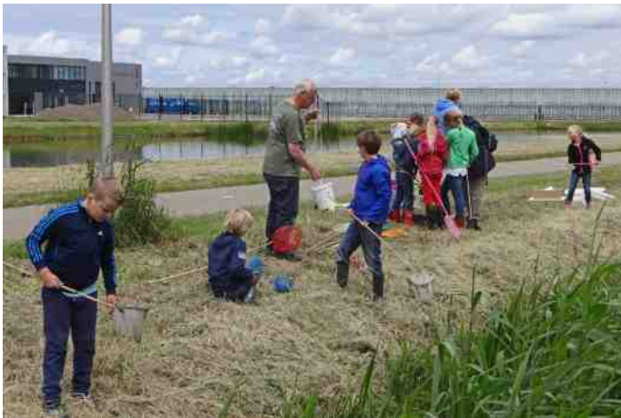
Schepnetjes zijn onmisbaar

Het is een behoorlijk gesjouw met al die slootjesspullen zoals schepnetjes, teiltjes, een grote bak, emmers, loeppotjes, zoekkaarten, limonade en koekjes. 'Vele handen maken licht werk', er zijn altijd wel vrijwilligers, die willen sjouwen.