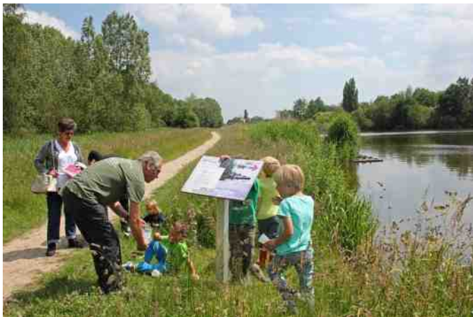
Op zoek naar drie soorten gele bloemen

dan de vissers. Tijdens het drinken werden we getraakteerd op een luchtshow van een Visdiefje: eerst hoogte maken en dan zoeffffffff... pijlsnel omlaag! Wat verderop zagen we wat verenresten van een Houtduif. Vermoedelijk opgepeuzeld door een Buizerd en niet door een Vos volgens Ben. Een roofvogel plukt zijn prooi en een Vos bijt de veren eraf. Onze Kapoentjes hebben weer een mooie veer toegevoegd aan hun collectie.