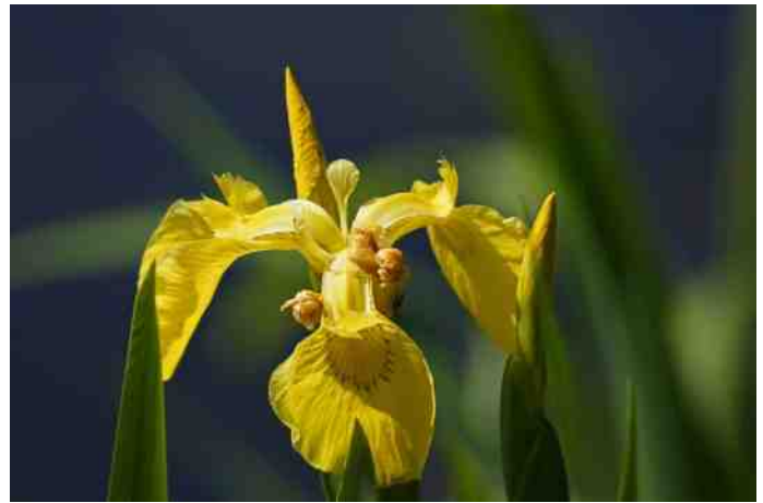
Gele lis © Arend Hoogeveen

alleen bij een wat hardere knal vliegen ze even op en landen kort daarna weer op het nest.