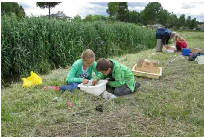
Serius onderzoek

Ter plekke hoor ik een grote plons en daarna nog één. Ik zet meteen een grote reddingsoperatie op touw, maar het blijkt loos alarm: er worden emmers in de sloot gegooid om water te putten om de teiltjes waar onze vangsten in moeten te vullen. We vangen dan wel geen Hollandse Nieuwe, maar bijvoorbeeld wel larven van Waterjuffers, veel kleine kriegelende beestjes, Kevelarven, een grote Poelstek, Posthoornslakken en roodbruine wormen. Enkele Rangers halen een levensgevaarlijk beestje uit de sloot, namelijk een Bootsmannetje. Dat beestje kan flink bijten. Het is trouwens het enige beestje, dat zijn diploma rugzwemmen heeft gehaald. 'Ik zwem op mijn rug en lijk daardoor op een bootje, dan kan ik mijn prooi beter zien'. We halen nog veel meer enge diertjes uit de sloot: Visbloedzuigers (brrrrrrrr), Zoetwatergarnalen (te klein om op te eten), Waterkevertjes, een rode Watermijt