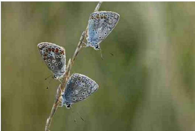
Icarusblauwtjes slapen graag bij elkaar

waren de vlinders nog bedekt met dauwdruppeltjes en vormden zodoende een dankbaar fotografisch onderwerp. Met het gegeven dat het Icarusblauwtje graag in gezelschap van soortgenoten voedsel zoekt en ook in groepsverband slaapt, maakt hem in mijn ogen tot een gezellig en sociaal vlindertje.