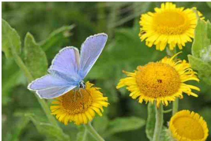
Icarusblauwtje (man) op Heelblaadjes

Het mannetje Icarusblauwtje valt in het veld meteen op door de helderblauwe bovenzijde, dat begrensd wordt door een dun zwart lijntje en zuiver witte franjes. Een stuk minder opvallend is het bruine vrouwtje met oranje vlekken op de voor- en achtervleugels. Veelal komen naast zuiver bruine vrouwtjes ook vrouwtjes voor met een variabele hoeveelheid blauwe bestuiving op de bovenvleugels. De onderzijde is bij beide geslachten bruin met zwarte, wit omrande stippen en langs de achterrand van de voor- en achtervleugels bevinden zich oranje vlekken. Soms ontbreken die oranje vlekken bij het mannetje op de onderzijde van de voorvleugel of zijn vaag aanwezig. Wat betreft het gedrag valt op dat je het Icarusblauwtje zelden alleen ziet rondfladderen, maar vaak met tientallen bij elkaar boven bloemrijke grazige plekken.