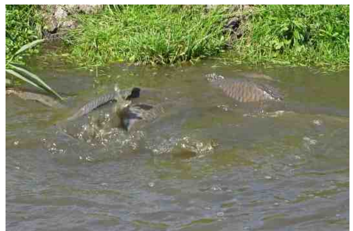
Paaiende karpers