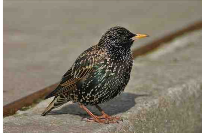
MB 74 Spreeuw