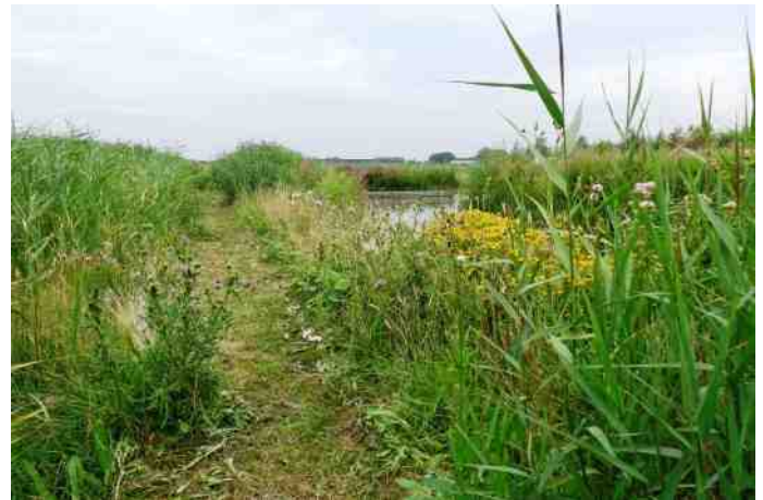
Natuurpad Wilderszijde

voet bij stuk te houden. Hoe het verder in de beide gemeenteraden af gaat lopen, is op dit moment nog onbekend. Direct daarna volgt de publicatie van het Ontwerp Tracé Besluit (OTB). Eind september is het zover. Dan wordt het ter inzage gelegd. Iedereen kan dan zijn of haar mening geven door een zienswijze in te dienen. Gezien de houding van de Minister en haar adviseurs tot nu toe, ziet het er naar uit dat er een lawine van papier naar Den Haag zal gaan. Maar wie weet, misschien worden we blij verrast? Voorlopig lijkt het vooral de apotheose van een slechte opera: voor de betrokken omstanders valt er weinig te genieten!