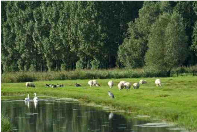
Hitland, slagenlandschap, bos en moerasland

De naam Hitland is ontleend aan shetland-pony's - hitten - die vroeger werden gebruikt om de karren te trekken met klei uit de Hollandse IJssel voor de steenbakkerijen. Hitland bestaat voornamelijk uit bos- en rietveen. Al snel kwam men erachter dat de kwaliteit van het veen erg laag was en niet geschikt om als turf te worden opgestookt. De veengrond was evenmin geschikt voor akkerbouw. Eerst was de grond daarvoor te nat en, nadat de bodem door windmolens was ontwaterd, was het veen te veel ingeklonken. Gevolg was dat de nadruk op veeteelt is komen te liggen, ook nu nog is er op beperkte schaal deze vorm van landbouw.