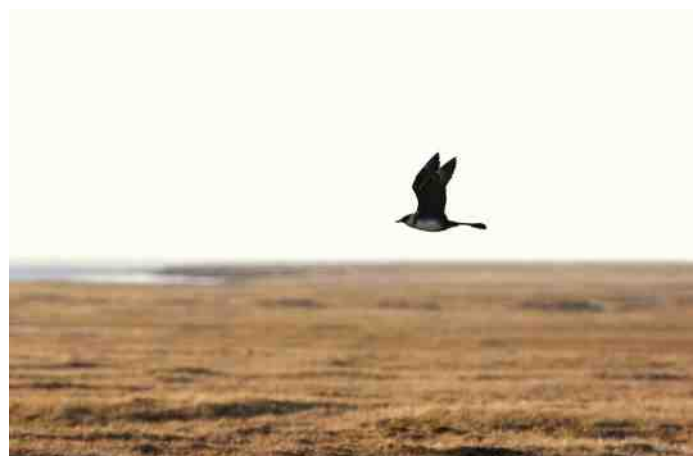
MB 76