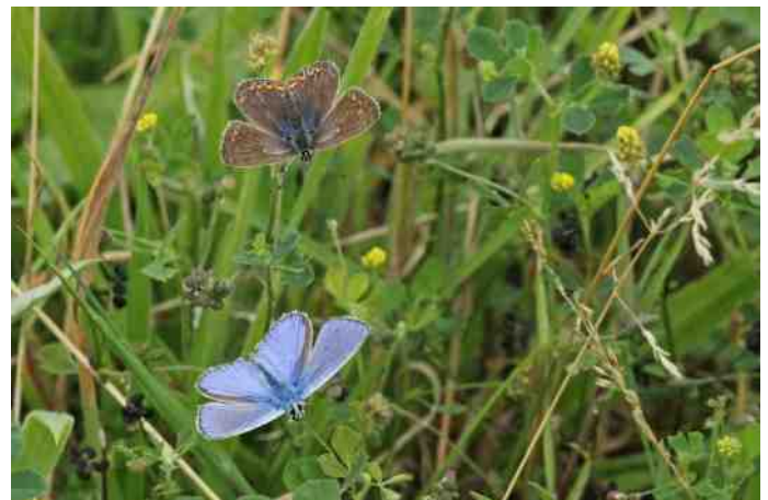
Mannetje en vrouwtje Icarusblauwtje

Het Icarusblauwtje is in ons werkgebied een algemene, plaatselijk zelfs talrijk voorkomende soort. Hij vliegt gewoonlijk in twee generaties, globaal vanaf half mei tot begin juli en van half juli tot begin september. In langdurig warme zomers ontwikkelt zich zelfs een derde generatie. Dit was bijvoorbeeld in 2014 het geval. Toen zag ik op veel plaatsen in ons werkgebied nog tot eind oktober