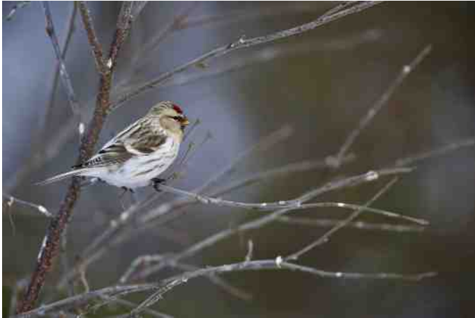
MB 73 Witsluitbarmsijs

Indien onbestelbaar retour: Hoeksekade 164, 2661 JL Bergschenhoek