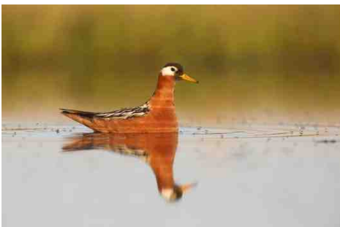
MB 75