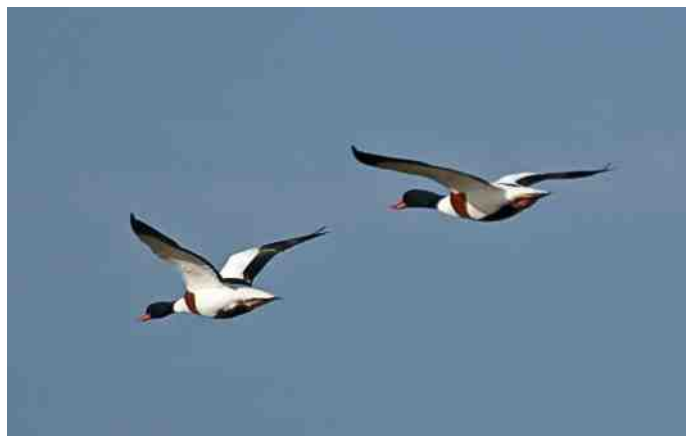
Bergeenden boven de Eendragtspolder

Om een dergelijke situatie in de toekomst te voorkomen, is het van belang dat het terrein voor vogels onaantrekkelijk wordt gemaakt om er op de grond te nestelen en te broeden. De Wg EDP is van mening dat dit mogelijk is. Optimaal is om er een halfharde laag overheen te leggen, echter de vraag is of hiervoor de financiële middelen beschikbaar zijn. Als alternatief adviseert de werkgroep om er met een hoge frequentie te maaien en het als losloop-/uitrenggebied voor honden aan te wijzen. Hierdoor is de kans het grootst dat vogels er van af zien om er een nest te bouwen. Gebleken is, bij waarnemingen tijdens de autocross, dat broedende vogels in het naastgelegen plas-/drasgebied zich nagenoeg niet storen aan het door de cross geproduceerde lawaai,