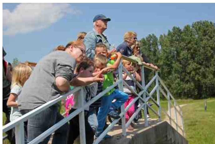
Met uitzicht op de familie Meerkoet

grond schieten. Een machtig gezicht was de zeker al anderhalve meter hoge Reuzenberenklauw, die zich aan het ontvouwen was. Onze Kapoentjes weten nu dat deze plant gevaarlijk is: raak hem niet aan.....op brandblaren en gemene wonden zit je niet te wachten! Het Groot hoefblad is veel onschuldiger, je kan het mooi als paraplu/parasol gebruiken. Kleefkruid doet het ook altijd goed bij kinderen. Regelmatig zag je van die dikke insectenpropjes vliegen, dat waren hommels. Eén van de hommels had aan z'n poot een geel bolletje zitten dat hij heeft gevuld met stuifmeel. In een opgedroogd moerasje zagen we Waterjuffers (met een blauw lantaartje) en er schoot een libelle voorbij: zo'n supersnelle dubbeldekker. Vlakbij twee vissers hebben we wat gedronken. Bij hen stond een Blauwe Reiger, wachtend op een maaltje vis. We hadden de indruk dat de Reiger beter op de dobber letten