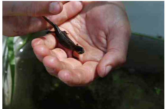
Kleine watersalamander

We zullen je niet lastig vallen met alle namen van de gevonden waterdierdjes, maar toch wel een paar: Posthoornslakken, Poelslakken, salamanderlarven, wel 7 Kleine watersalamanders, kikkervisjes, Groene kikkers, stekelbaarsjes, een jonge Snoek, allerlei zwarte waterkevers (van klein – groot), een Geelgerande watertor, Bootsmannetjes, Schaatsenrijders, diverse larven (o.a. van een Libelle), enz.