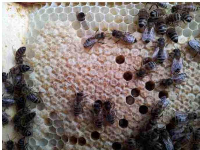
Bijen en broedcellen

pad om de voor de kolonie noodzakelijke voedingsstoffen te verzamelen. Het gaat dan om water, nectar en stuifmeel. Ook haalt ze dan nog een belangrijke stof, de propolis, en harsachtige substanties die de bijen gebruiken als schoonmaakmiddel en kit waarmee kieren gedicht worden. Ook worden infectiebronnen in de kolonie in propolis ingepakt om te voorkomen dat een infectie zich in de kolonie verspreidt.