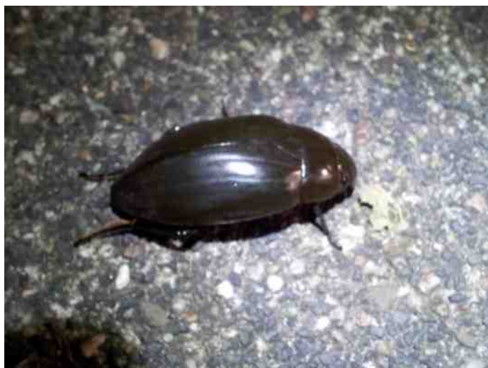
Grote spinnende waterroofkever

Stuur daarvoor een email met je naam, adresgegevens en gewenst aantal en de maten (S, M, L, XL of XXL) naar jan.mudde@gmail.com . Doe dat zo snel mogelijk want dan heb je het T-shirt nog voor de feestelijke decembermaand in huis.