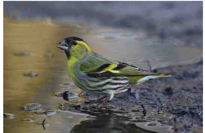
MB 58 Sijs