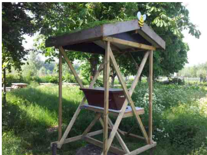
Opstelling Keniakast bij het Trefpunt

Het afgelopen seizoen heb ik de bijen in deze kast met belangstelling gevolgd. Door regelmatig een tijdje bij de kast te kijken krijg je steeds meer respect voor deze diertjes. Het volk dat de kast bewoond is een zwerm die door Johan geschept is. Scheppen is het opvangen van een bijenzwerm die zich ergens in de buitenruimte bevindt. Een zwerm bestaat uit een oude koningin van een volk dat te groot is