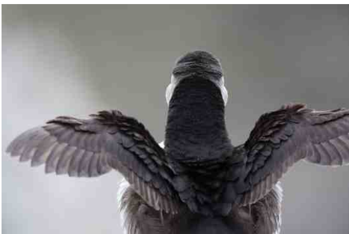
MB 59

Bijgaand 2 nieuwe foto's. Je kunt je oplossing naar mij mailen (cdvrijswijk@gmail.com) of zelf de antwoorden onthouden. De oplossing staat in het volgende nummer. Vanaf deze Mystery Bird is de competitie voor de twee waardebonnen gestart. Deze worden voor het eerst in maart 2014 tijdens de ledenvergadering uitgereikt. Zie pagina 14 voor meer informatie. Succes...Kijk ook eens op mijn website: www.birdshooting.nl