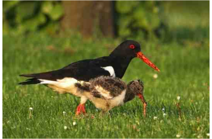
Scholekster met nog niet vliegvlug jong met regenworm (Bleiswijk).

Scholeksters broeden op verschillende plaatsen op de grond: op kale akkers, in korte graslanden en op tijdelijk schaars begroeide terreinen zoals de Eendragtspolder en de Nieuwe Droogmaking noord van Rodenrijs. Er werden in totaal 21 (waarschijnlijke) broedgevallen op daken geconstateerd, vermoedelijk een klein deel van het werkelijke aantal. Scholeksters zijn wat broedplaats betreft erg plaatsgetrouw. Dit blijkt ook uit een melding van de heer Van Dort uit Bleiswijk, die het wel en wee van een Scholeksterpaar dat vlakbij zijn huis broedt al jaren volgt. De vogels broeden al minstens zes jaar op een plat dak in de Vermeerstraat te Bleiswijk en soms broeden er zelfs twee paar. Van Dort meldt: "De jonge vogels (1 of 2) vallen van het dak (denk ik), bereiken wel goed de grond, lopen wat heen en weer onder luid geroep van hun ouders boven op het dak, maar vallen ten prooi aan een kat of worden door een auto aangereden. Zij hebben geen enkele kans. Toch