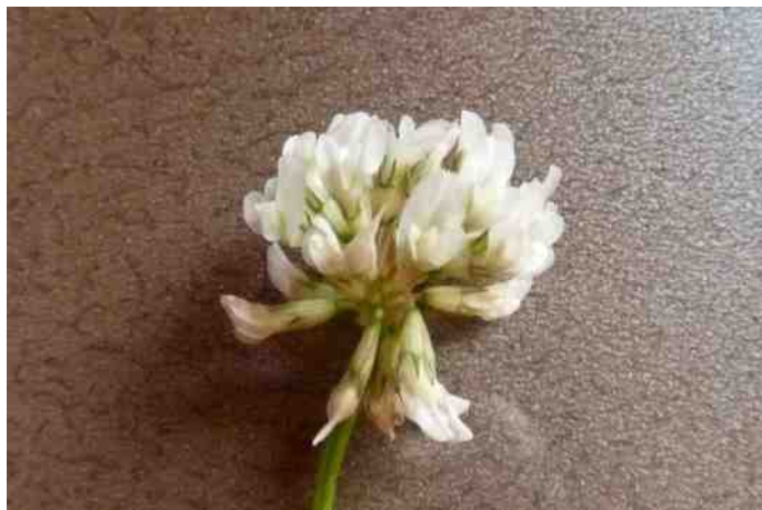
Witte klaver

Plotseling komt iets met lange oren en lange achterpoten uit de bosjes huppelen. Het is een mooie slanke Haas die me gedurende een paar minuten van opzij blijft bekijken. Blijkbaar voelt hij zich veilig, want hij komt ook nog een klein stukje dichterbij. Dan gaat hij rechtop zitten met zijn voorpoten los van de grond. Hij spitst zijn oren en is met zijn neusje onrustig aan het snuffelen. Typisch het gedrag van een Haas. Als mijn stoel kraakt, omdat ik een klein beetje beweeg, gaat hij er als een Haas vandoor. Ik kijk hem na en zie hem in de verte de hoek om verdwijnen. Enkele minuten later komt hij vrolijk terug gehuppeld en verdwijnt in de struiken. Ik ga maar niet kijken en gun hem zijn rust. Waarschijnlijk zit hij in de bosjes stiekem te wachten tot ik wegga. Een Haas kan wel 65 kilometers per uur lopen. Het mannetje van de Haas heet rammelaar en het vrouwtje moeder.