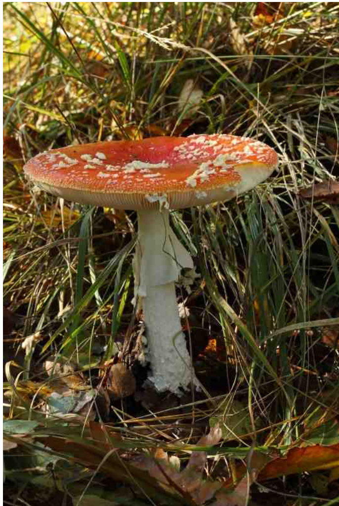
Vliegenzwam, volgroeid stadium

van draden – de bodem veel beter doorgroeit dan de veel grovere plantenwortels ooit zouden kunnen. Bijna alle planten (tenminste 80% van de bekende soorten) leven via symbiose samen met één of meer schimmels en daardoor zijn zulke samenlevingsverbanden van onschatbaar belang voor het leven op aarde.