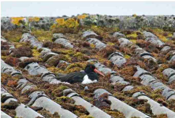
Broedende Scholekster op golfplatendak langs de Rottebandreef bij het Trefpunt.

proberen de ouder-scholeksters het elk jaar weer opnieuw". Er zijn er ook berichten over succesvolle broedgevallen. In de omgeving van de Söderblomplaats in Ommoord volgde Ellen Beckmann weer twee paar die hier al enkele jaren broedden. Dit jaar werden van elk paar met succes twee jongen vliegvlug.