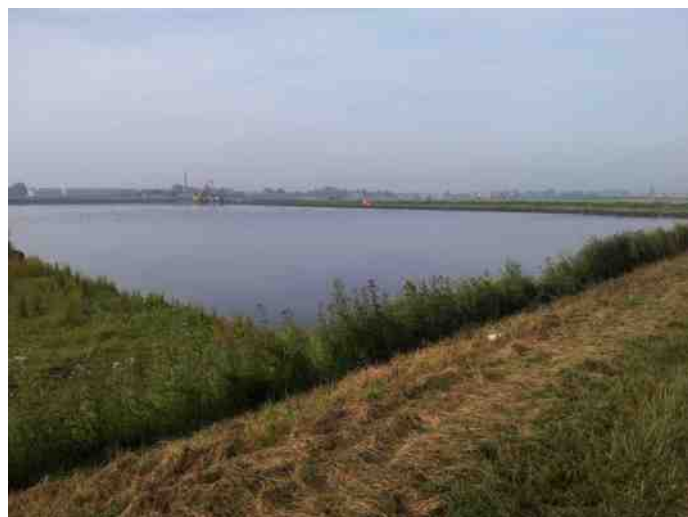
Centrale plas Groenzoom

werkt wordt aan de infrastructuur van het gebied tussen de Klapwijkseweg en de Kleihoogt. Er worden brede watergangen gegraven, delen van het gebied verlaagd t.b.v. toekomstige rietvelden en kades aangelegd voor wandelen en fietspaden. In de Klapwijkse Knoop zijn watergangen verbreed en zijn er struiken en bomen aangeplant. Tussen de Middelweg en de Pastoor Verburghweg wordt er gewerkt aan de aanleg van nieuwe watergangen en vanaf de Pastoor Verburghweg is er heel recent langs de N 470 een nieuw fietspad richting Zoetermeer aangelegd. Het algemene beeld is dat de ontwikkeling nu echt op gang is gekomen. Het zal nog wel een paar jaar duren voordat alle inrichtingswerkzaamheden zijn afgerond maar wat zegt dat als je weet dat de eerste plannen voor de 'Groen Blauwe Slinger', waar de Groenzoom onderdeel van is, al in 1989 werden gepubliceerd. Met andere woorden: we zijn er bijna!