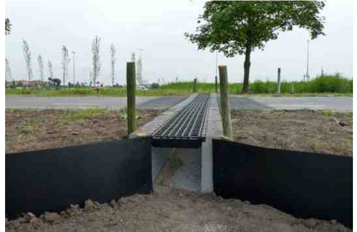
Faunapassage bij de Klapwijkse Knoop

beheerd moet worden maar ook door zelf aan de slag te gaan. Gelukkig hebben we kennis en menskracht in huis via onze werkgroep Rotta Natuur! Vrijwilligers zijn nog steeds welkom! Nu naar de realiteit van vandaag want er zijn nog steeds zaken die de aandacht vragen.