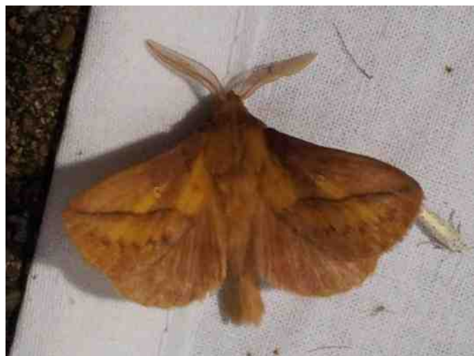
Rietvink © Jan Mudde

De laatste nachtvliedernacht waar ik in dit artikel even bij stil wil staan is die waarin we met de opstelling een bezoek brachten aan de Wiebertjes. Door de inzet van de technische mannen van het Trefpuntbeheer is de opstelling namelijk ook onafhankelijk van het lichtnet te gebruiken. Met behulp van een tweetal accu's en een omvormer kunnen we ongeveer 5 uur aaneengesloten de lamp laten branden. Alle benodigdheden passen perfect in de Rotta fietskar en dus kunnen we ook in het verre veld aan de slag. Op zaterdagavond 3 augustus hebben we het laken opgezet bij het gronddepot van de GZH nabij de Wiebertjes, gelukkig was Bart Dieleman er al vroeg bij en hoefde ik daarom dit keer niet in mijn eentje te prutsen. Om exact 22:00 uur ging de lamp aan. Het wachten op de vlinders kon beginnen. Je moet namelijk weten dat het echte nachtvlieders in de zomermaanden vaak pas rond een uur of twee 's nachts begint. Deze avond liep het echter een beetje anders. Al