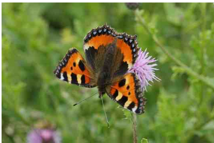
Kleine vos op Akkerdistel