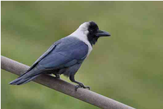
MB 57 Huis kraai

Indien onbestelbaar retour: Hoeksekade 164, 2661 JL Bergschenhoek