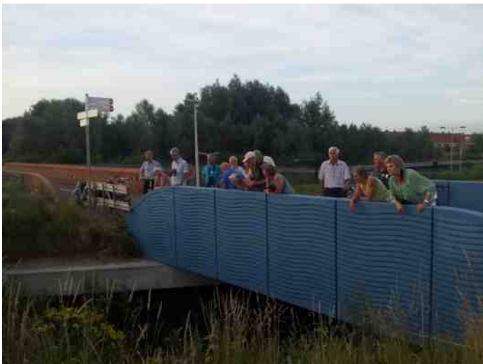
Rotta op de fiets bij smalste faunapassage in de Groenzoom

Eerst maar de natuur rond de nieuwe Willem Alexander roeibaan . Een schitterend gebied! Wat kunnen we daar allemaal niet verwachten in de toekomst! De Bleiswijkse Zoom-Noord is ingericht, ook daar is de natuur volop bezig zich te ontwikkelen. Park de Polder in Bergschenhoek is klaar en kan met een zorgvuldig beheer tot een waardevol gebied uitgroeien. De ZORO busbaan langs de Landscheiding is op een zorgvuldige manier aangelegd, de Landscheiding is grotendeels in tact gebleven, de bus rijdt met succes en op verschillende plaatsen kan er natuurontwikkeling plaatsvinden waar we echt wat van verwachten. Aan het Annie M.G. Schmidtpark tussen Berkel en Bergschenhoek wordt hard gewerkt, het is vooral een publiekspark, toch zijn en komen er plekken waar de natuur haar gang kan gaan.