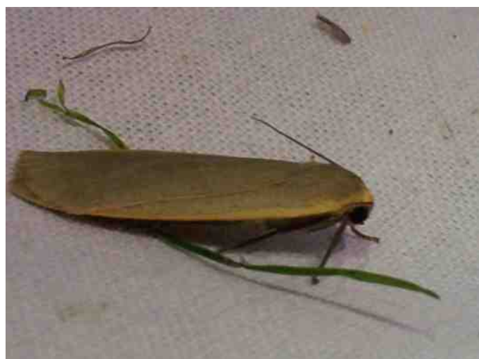
Glad beertje

tjes een ideaal biotoop voor deze soort is bleek gedurende de rest van de avond en nacht wel. In totaal zijn zeker dertig Rietvinken op de lamp afgekomen en je moest uiterst omzichtig je voeten verplaatsen want als je even niet oplette stond je bovenop zo'n prachtig bakbeest. Dat niet alleen vlinders op een lamp afkomen bleek ook nu weer. In totaal hebben deze nacht een achttal bezoekers gehad die kortere of langere tijd mee hielpen met het determineren. Naast de al eerder genoemde soorten hebben zij onder andere ook de volgende beestjes kunnen zien; Braamvlieders, Schedeldrager, Donker klaverblaadje, Hyena, Geelschouder-spanner, Koperuil, Puta-uil, Kameeltje, Populierenpijlstaart, Kameeltje. De bonte verzameling namen illustreert heel mooi de enorme variëteit aan afmetingen, vormen en kleuren die in deze diergroep voorkomen. De kleinste vlinder die we gezien hebben is niet groter dan 5 mm terwijl de grootste bijna 5 cm meet. De vormen en kleuren laten zich minder eenvoudig omschrijven, die moet je gewoon zelf een keer komen ervaren. De komende maanden, tot in november, zullen we waarschijnlijk nog een aantal avonden gaan nachtvlieders. Omdat dat heel sterk weersafhankelijk is zijn er nog geen data bekend. Op het laatste moment zullen we dag, locatie en tijdstip bekend maken via de website en de Facebookpagina van Rotta. Het is zeker de moeite waard om eens een avondje mee te vlinders! Tot ziens bij het laken.