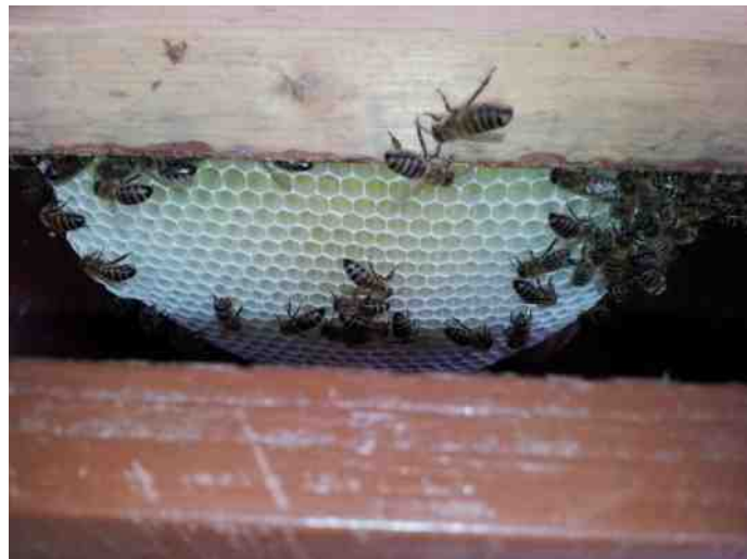
Nieuwe raat in de Keniakast

schoonhouden van de kolonie. Na deze periode gaat ze een dag of twee als wachtbij aan de slag. Bij die taak bewaakt ze de ingang van de kolonie en zorgt er voor dat er geen vreemde indringers de kolonie binnen kunnen. Ook maakt ze een aantal verkenningsvluchten in de buurt van de kolonie, het zogenaamde voorvliegen. De daaropvolgende drie weken is ze een haalbij en gaat ze dagelijks op