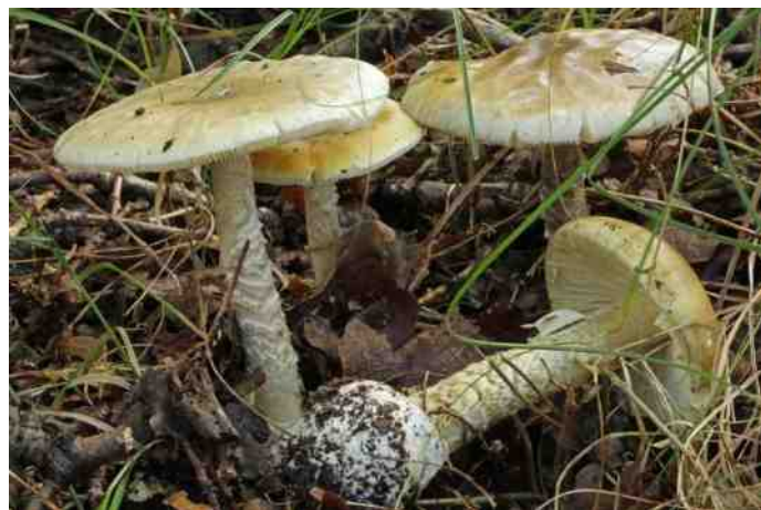
Groene knolamaniet, dodelijk giftig

De vliegenzwam behoort met nog 20 andere soorten in Nederland tot de groep Amanieten, geslachtsnaam Amanita . Het is een groep plaatjeszwammen met een velum universale . Dit is het vlies dat bij het jonge stadium de gehele hoed omspant en later als schubben of vlokken (de zogenaamde witte stippen bij de Vliegenzwam) op de hoed en als beurs om de steelvoet achterblijft. Meestal hebben de vertegenwoordigers van deze groep ook een velum parziale dat als een ring om de steel achterblijft. Er is nog een geslacht waarbij de steelvoet omsloten wordt door een beurs, namelijk het geslacht Volvariella (zie Aves Visum nr. 124, juni 2013).