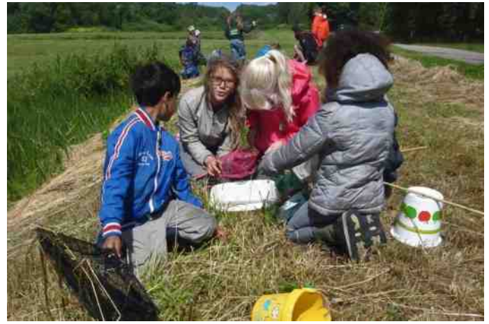
Samen op de knieën kijken naar de vangst

Wat een enthousiasme bij beide groepen! Als leiding liep je van de ene vondst naar de andere. Samen probeer je dan via de zoekkaart de naam van een gevonden water-