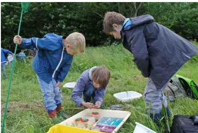
Bekijken wat je gevonden hebt.

(Bege-)Leiding en catering hartelijk dank voor jullie enthousiaste inzet.