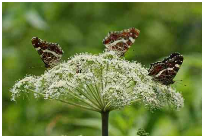
Karakteristieke onderzijde van het Landkaartje