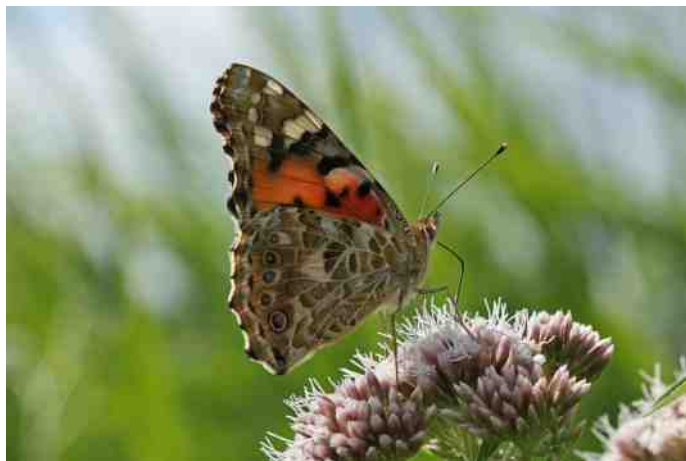
Atalanta op Koninginnekruid

Landelijk gaat het deze vlinder voor de wind. Het verspreidingskaartje van de Vlinderstichting in de periode 2000-2013 laat een grotendeels landdekkende presentie zien. Helaas ben ik er nu pas achter, dat de soort een algemene verschijning is in ons werkgebied. Waar een hittegolf al niet toe kan leiden!