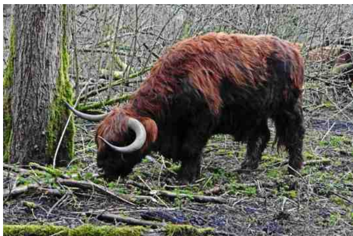
Schotse hooglander in het Lage Bergsche Bos

Goed, aan de wandel. Een Schotse Hooglander staat heel rustig en onverstoorbaar te grazen. Hij trekt zich van al die Rottaleden en medewandelaars niets aan. Zelfs mijn knalrode jack sorteert geen enkel effect op dat beest met die grote hoorns. Merels zingen volop. Een Zanglijster herhaalt telkens hetzelfde liedje, het is net een grammofoonplaat met een barst. Een Zanglijster zingt in de lente als eerste. Hij zit overal, zelfs in woonwijken. Grauwe Ganzen zien en horen we overal. Wat een druktemakers. Wat heel leuk is, is het constante geroffel van de Grote Bonte Specht. Het is de enige specht die roffelt. We worden keihard uitgelachen door de Groene Specht. Zien doen we hem natuurlijk niet, want dan hadden we wel keihard teruggelachen.