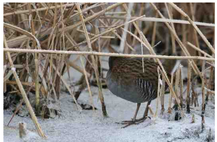
MB 60