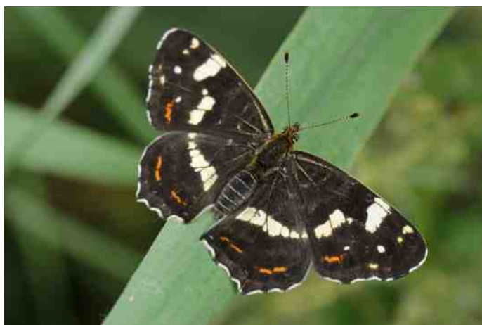
Zomervorm van het Landkaartje