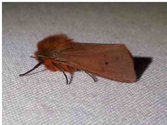
Kleine beer

direct in het eerste uur hadden we leuke soorten en aantallen op het laken en voor middernacht hadden we onze handen vol aan het fotograferen en determineren van de bonte stoet nachtvlieders die ons met een bezoek vereerden. Een Kleine beer en een Glad beertje waren zo ongeveer de eersten die op het laken verschenen. En al snel verscheen de eerste Rietvink, dat is uiteraard geen vogel, maar een zeer forse, geelbruine nachtvlieders waarvan de rups vooral Riet als waardplant heeft. Dat er in de Wieber-