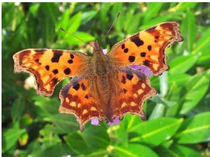
Gehakkelde aurelia