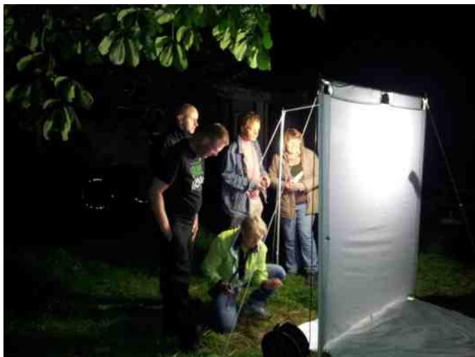
Nachtvlinderaars bij het Trefpunt