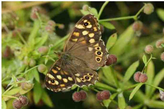
Bont zandoojje op Kleefkruid