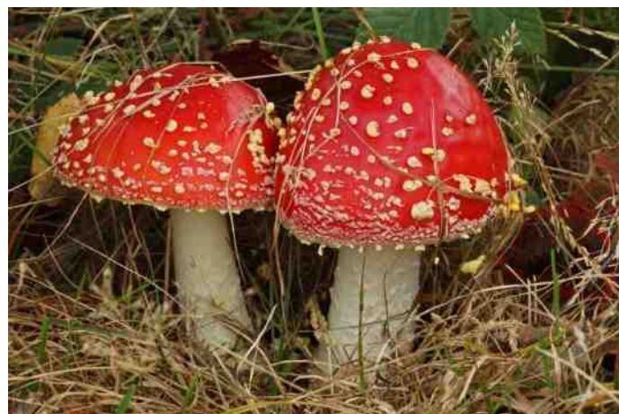
Vliegenzwam, jong stadium

Het is niet helemaal duidelijk hoe de Vliegenzwam aan haar naam gekomen is. Een aannemelijke verklaring is, dat men enkele eeuwen geleden al ontdekt had dat de Vliegenzwam prima ingezet kan worden als vliegenverdelgingsmiddel. Men drenkte het rode vlies van de hoed in een schoteltje melk, waarbij de dodelijke stof muscarine vrij kwam. Linnaeus (1707-1778) maakte in zijn reis door het Zuid-Zweedse landsdeel Götaland, dat in die tijd nog tot Denemarken behoorde, melding van hoe ook hij de Vliegenzwam als dodelijk wapen gebruikte. Hij smeerde de muren van zijn verblijf in met de rottende pulp van de vruchtlichamen, waarna de vliegen massaal stierven. Uiteindelijk was het deze Zweedse botanicus die de Vliegenzwam de Latijnse soortnaam Amanita muscaria gaf. Muscaria betekent vlieg.