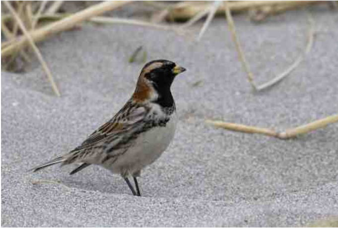
MB 53 IJsgors

Indien onbestelbaar retour: Hoeksekade 164, 2661 JL Bergschenhoek