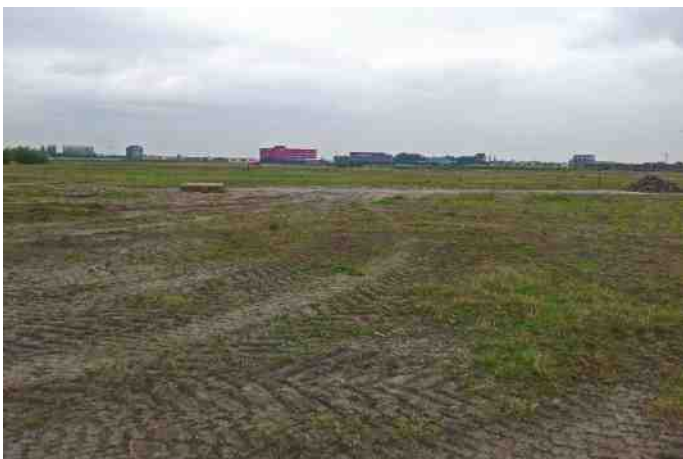
Braakliggend land geeft nieuwe kansen voor de natuur.

Het is dan ook te hopen dat de gemeentebestuurders de waarde van dit gebied zoals het nu is onder ogen gaan zien en af zullen zien van het realiseren van allerlei wilde initiatieven van individuele burgers en andere partijen die er toe bij zouden moeten dragen dat het gebied de gemeente minder geld kost. Tot op heden heb ik in ieder geval nog geen initiatieven gezien die geld op gaan leveren, wel veel ideeën die de Lansingerlandse gemeenschap uiteindelijk nog veel meer geld gaan kosten. Duurzaam braak laten liggen met hooguit aan de randen een enkele goede hondenuitlaatfaciliteit kost het minst en levert de meeste natuur- en milieuwinst op. Door in de rest van het gebied een hondenverbod in te stellen en het terrein wel toegankelijk te maken voor wandelaars op de bestaande verharde paden geeft de gemeente haar burgers de unieke kans kennis te maken met een buitengewoon waardevol stuk "onbedoelde" natuur. Op deze plaats wil ik dan ook de bestuurders van Lansingerland van harte uitnodigen om samen met mij in het komende voorjaar eens een rondgang door het gebied te maken opdat ze zelf kunnen ervaren wat een waardevol gebied er al aanwezig is. Binnenkort start ik met de broedvogelinventarisatie van 2013 in dit bijzondere gebied!