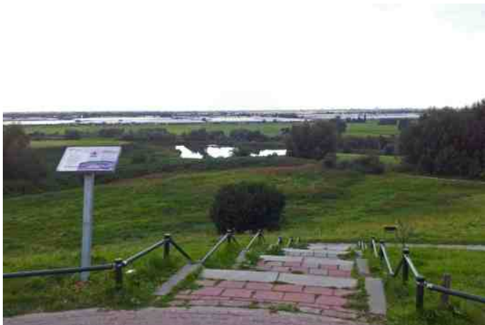
Aan de westzijde gaat de Rotte-natuur direct over in het kassengebied van Bergschenhoek en Bleiswijk.