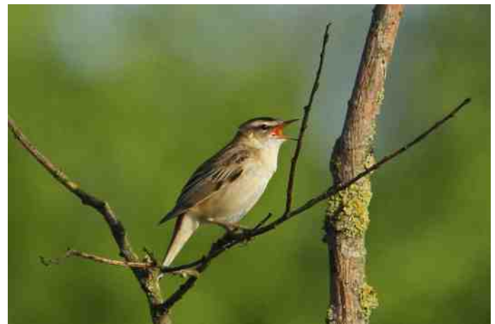
Rietzanger ( Acrocephalus schoenobaenus )