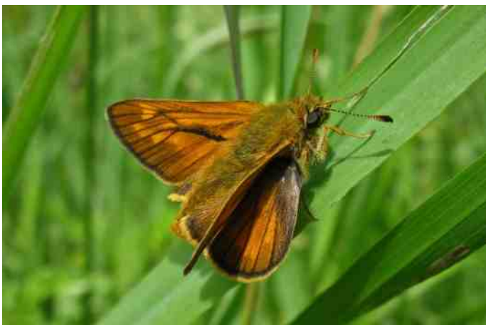
Groot dikkopje ( Ochlodes sylvanus )

Hopelijk zal het volgend vlinderseizoen beter zijn. Ik kijk er nu al naar uit.