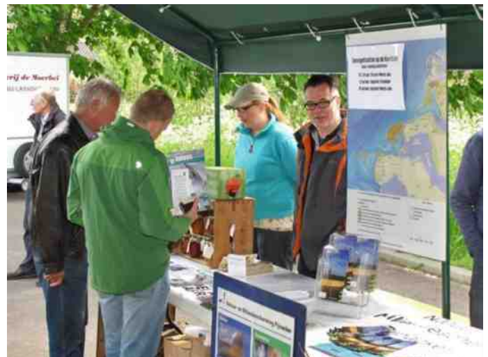
Bij de stand van Deltasafari konden velerlei producten uit de boomgaard van het Nessebos verkregen worden. Ook was er veel belangstelling voor de zoogdier- en vogeltrips in de Delta vanuit Stellendam.