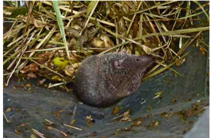
Huisspitsmuis ( Crocidura russula )

Door het rietveld in stroken te maaien, met een interval van twee tot drie jaar, kan een grotere variëteit worden verkregen, tevens kunnen de soorten die thuishoren in dergelijke biotopen er zich beter vestigen.