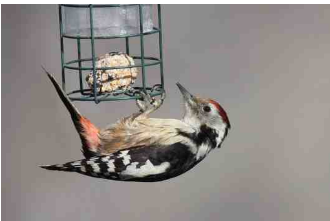
MB 55