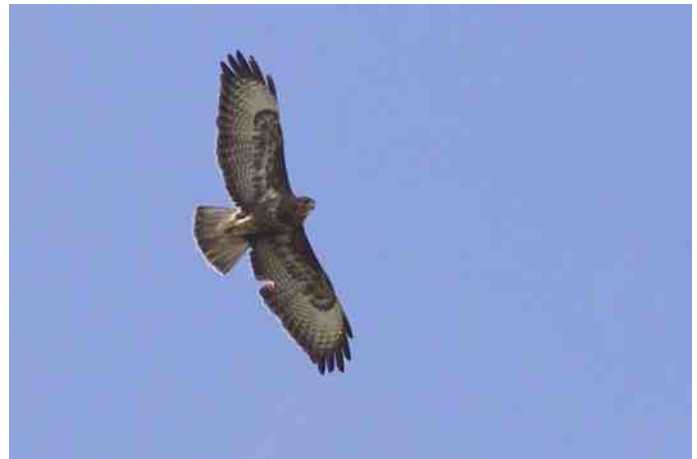
Buizerd met donkere onderzijde.

Dertig jaar geleden was de Buizerd een roofvogelsoort die we in onze omgeving uitsluitend in de wintermaanden konden bewonderen. Hoe anders is dat tegenwoordig. Het hele jaar door kunnen we nu in ons werkgebied genieten van deze majestueuze vogel. Sterker nog, op diverse plaatsen wordt ijverig aan het nageslacht gewerkt. Rond deze tijd van het jaar zijn ook de Buizerden in voorjaarsstemming. Overal waar je buiten bent hoor je het kenmerkende klaaglijk mauwende geluid van de baltsende vogels, let er maar eens op. Het klinkt ongeveer als een hoog boven je vliegende, roepende kat. Als je dan zorgvuldig de lucht afspeurt ontdek je de vogels vanzelf. Wees er wel op bedacht dat baltsende Buizerds erg hoog kunnen vliegen en dus relatief erg klein lijken. Door het roepen naar elkaar komen de mannetjes en vrouwtjes met elkaar in contact.