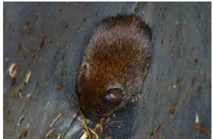
Rosse woelmuis ( Myodes glareolus )