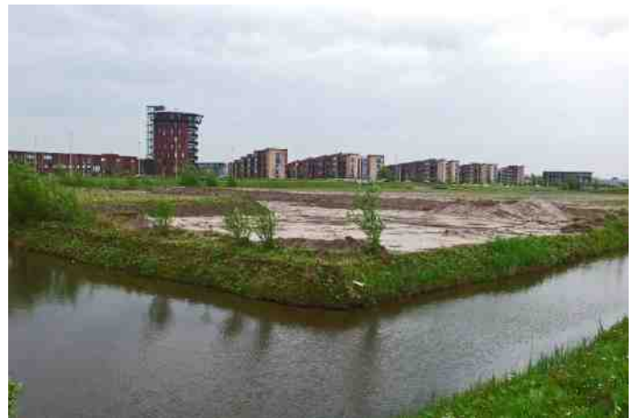
Langs de Boterdorpsweg

zijn van twee paartjes de jongen ten prooi gevallen aan de regelmatig in het gebied rondstruinende loslopende honden. Hondeneigenaren beseffen nog steeds onvoldoende dat hun trouwe viervoeter nog altijd over een jachtinstinct beschikt en vinden het daardoor onnodig om hun huisdier aan te lijnen in het veld. Ook onder de weidevogels zijn helaas meerdere jongen door hondensterf om het leven gekomen. Toch hebben enkele tientallen jonge Kieviten, Grutto's en Tureluurs het gebied kunnen benutten om op te groeien tot volwassen vogel. De Rietzomen in het gebied zijn uitgebreid benut door de bekende soorten. Rietzanger, Rietgors, Kleine Karekiet waren met tientallen paren aanwezig. Ook de Bosrietzanger heeft in 2012 weer op diverse plekken gebroed. Deze rijkdom aan Rietbewoners trok ook nu weer zeker twee vrouwtjes Koekoek die een gastgezin voor hun kroost zochten. Een andere broedvogel van het gebied is de Waterral. Het is een prachtig gezicht om de jonge Waterrallen vergezeld van de ouders rustig aan de rand van het Riet te kunnen zien foerageren. Door al vroeg aanwezig te zijn en een paar uur stil te blijven zitten heb ik dit meerdere malen mogen beleven. Een deel van het gebied was, door het in 2011 op grote hopen storten van grond, een waar broedparadijs voor de Kneu. Enkele tientallen paartjes hebben er dankbaar gebruik van gemaakt. Meerdere paren Gele en Witte Kwikstaart hebben ook hun kroost in het gebied grootgebracht.