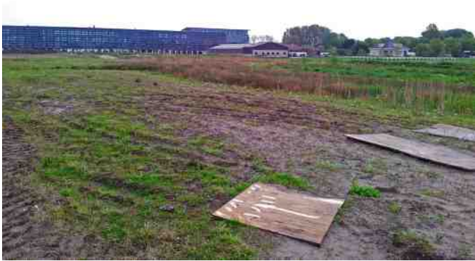
De achtertuin van het nieuwe gemeentehuis

lezen aan onder andere het voorkomen van de Brede Rietorchis en de grote populatie Hazen. Ook de Haas heeft het in de rest van Lansingerland uitermate moeilijk om zich te handhaven. De verreгаande verstedelijking en verglazing van het landelijk gebied in de gemeente is daar debet aan.