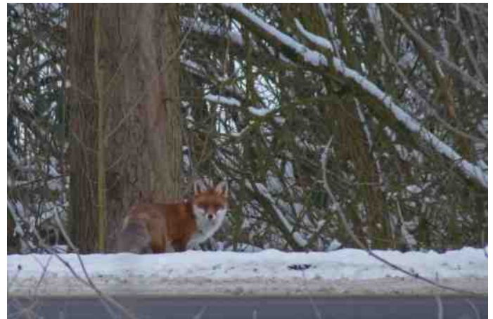
Was dit de dader? © Jesse Keyzer