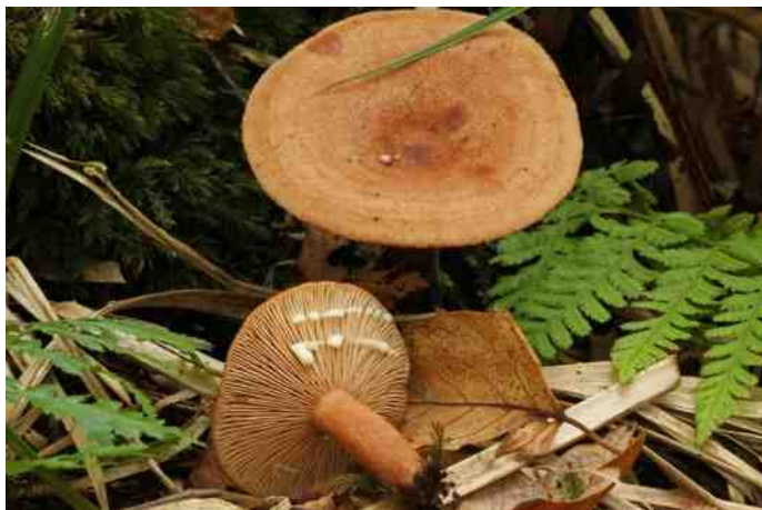
Kaneelkleurige melkzwam ( Lactarius quietus )

Paddenstoelen inventariseren is verre van eenvoudig.