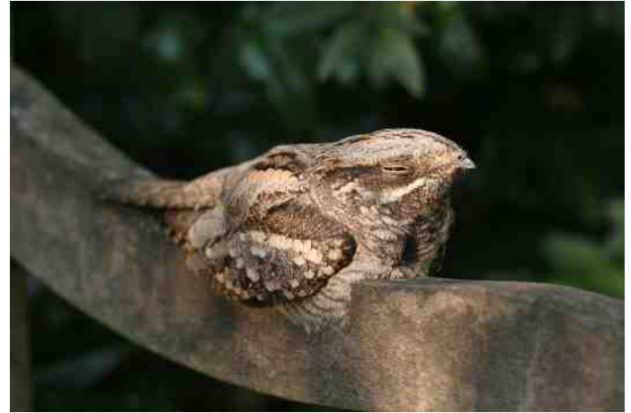
MB 54 Nachtzwaluw