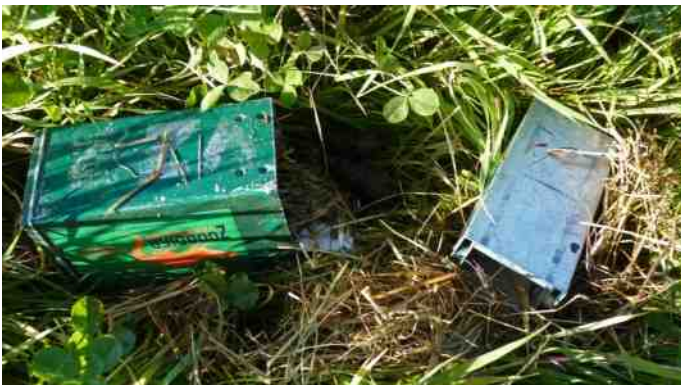
Natuuronderzoek wordt soms gefrustreerd door de natuur zelf. Deze inloopval werd geplunderd door een vos!

Een doorkijkje naar de resultaten van de diverse onderzoeken is, naast dit jaarverslag, de hoofdmoot van deze Aves Visum. Van verschillende onderzoeken zullen nog aparte verslagen gepubliceerd worden. Voor 2013 staat een continuering maar ook uitbreiding van het onderzoek op stapel. Ook daarover heeft u in dit blad al meer kunnen lezen. We houden u op de hoogte van de ontwikkelingen via de publicatieborden in ons verenigingsgebouw, Natuurcentrum Trefpunt Rotta, de website, Facebook en natuurlijk het clubblad.