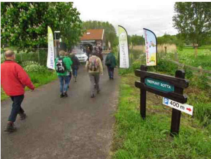
Op 12 mei 2012 werd het 30-jarig bestaan van Rotta gevierd. De bezoekers kwamen in grote getale.

Zaterdag 15 september waren we present bij de Vrouwen van. Nu in Moerkapelle, op het Land van Belofte. Dit jaar was