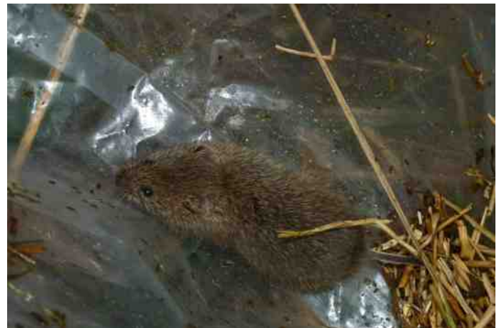
Veldmuis ( Microtus arvalis )