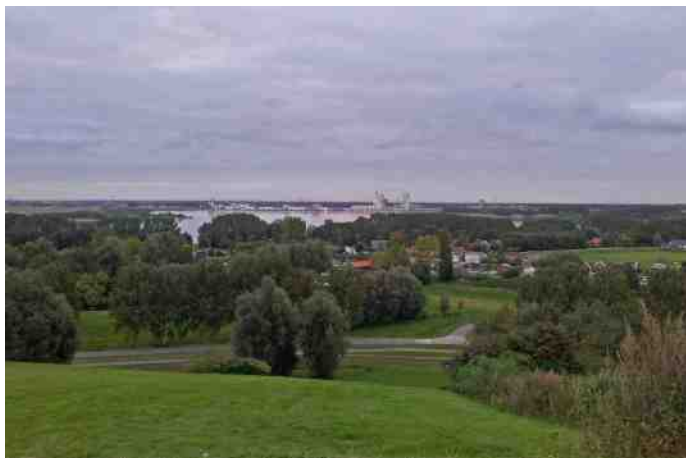
Uitzicht vanaf Lührs naar de Zevenhuizerplas en Nesselande. Het Rottemerengebied grenst direct aan de verstedelijking.

De eerste telling in het voorjaar was op zondag 11 maart en gelijk al goed voor een dagrecord aan noordwaarts trekkende Kramsvogels. Niet minder dan 198 exx. passeerden in een paar uur tijd de telpost. Leuk detail is dat deze lijst de enige soort is die in de gehele periode van 11 maart tot en met de laatste voorjaarstelling op 19 april bij elke telling gezien is. Verder is tijdens de totaal zeven teldagen in maart en april weinig bijzonders gezien. Op de twaalfde april na dan. Op die dag lieten zich maar liefst 19 Beflijsters bewonderen in de bosschages rond het telpunt! Een fantastisch gezicht!