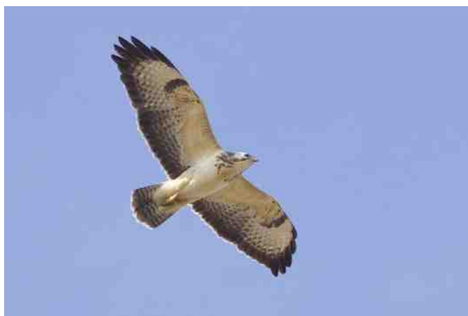
Buizerd met lichte onderzijde

De Buizerd is op zich een erg makkelijk te herkennen roofvogel. Met zijn formaat van een forse Zwarte Kraai en ook nog eens een steviger bouw en forser gewicht is het in onze omgeving veruit de grootste roofvogel. De brede vleugels, relatief korte kop en korte staart maakt hem, ook als hij hoog over cirkelt, heel herkenbaar. In zit is het de enige roofvogel in onze omgeving die dit formaat heeft en dan ook nog eens een voornamelijk bruin verenkleed heeft. Buizerds zitten graag op hekpaaltjes in het landschap. Is er dus één fors langer paaltje in een hele rij paaltjes dan is de kans erg groot dat daar een Buizerd op zit. Het venijn bij de herkenning van de Buizerd is echter wel dat het verenkleed enorm variabel kan zijn. Alle mogelijke kleden bespreken voert in het kader van dit stukje veel te ver, je kunt er namelijk een heel boek over schrijven. Kijk maar eens in een goede vogelgids en je begrijpt wat ik bedoel. Een eerste indicatie wordt gegeven door bijgaande foto's.