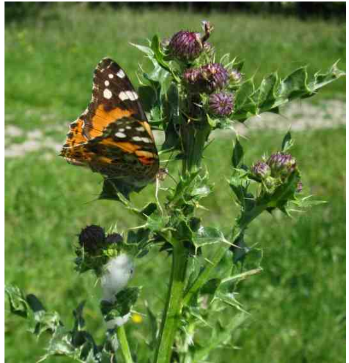
Distelvlinder ( Vanessa cardui )

In 2012 leek het vlinderseizoen mooi te beginnen met een warme maartmaand. Er werden toen al redelijk veel vlinders gezien. Maar vanaf april was het over met de warmte en