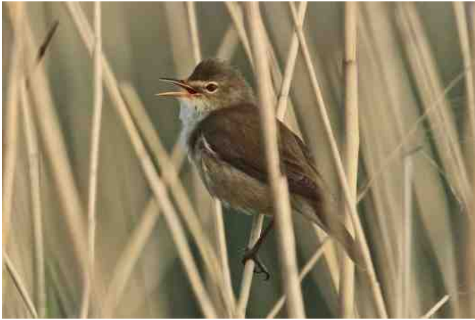
Kleine Karekiet ( Acrocephalus scirpaceus )

Het meest bijzonder is natuurlijk het territorium van een Woudaap. Gedurende de maanden juni en juli werden Woudapen door vele waarnemers gezien. De meest opmerkelijke waarnemingen zijn: voedselvluchten van een adulte man en vrouw op 9 juli (Jan Mudde) en een adult en juveniel waargenomen op 25 juli (Norbert van de Grint, www.waarneming.nl )