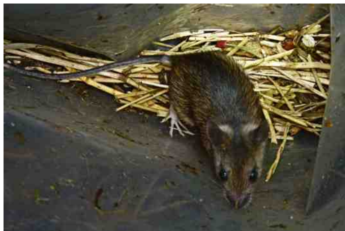
Bosmuis ( Apodemus sylvaticus )

In een rietveld zoals bij de Zevenhuizerplas kunnen bijzondere soorten voorkomen zoals de beschermde Noordse woelmuis en de beschermde waterspitsmuis. Deze werden helaas niet gevangen. Wel werden vijf andere soorten gevangen: Bosmuis, Dwergmuis, Huisspitsmuis, Rosse woelmuis en Veldmuis. Tevens werden waarnemingen van Vossen gedaan, zowel zichtwaarnemingen als sporen. Meerdere malen werden vallen op andere plaatsen teruggevonden, opengebrouwen en leeggeschud.