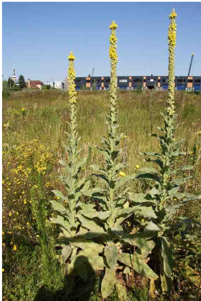
Koningkskaars ( Verbascum thapsus ) op bedrijventerrein Weg en Land, Bergschenhoek.

In de kruidlaag van sommige, weinig verstoorde bospercelen van het Lage Bergse Bos zijn varen algemeen: de Brede stekelvaren, Mannetjesvaren en Wijfjesvaren. In veel bospercelen is het Groot heksenkruid algemeen. Deze zomerbloeiër verspreidt zich gemakkelijk doordat de vruchten met talrijke haakjes zijn bezet en deze over grote afstand mee kunnen meeliften met dieren, maar bijvoor-