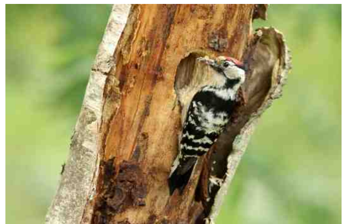
MB 56 © Chris van Rijswijk